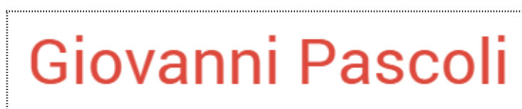
Figura 2: Casella di testo

Inseriamo alcune note adesive di vari colori per fissare i concetti più importanti: